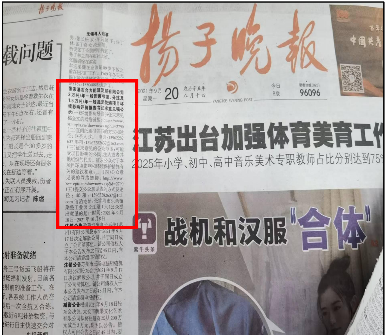
图 3-3 2021 年 9 月 20 日登报公示