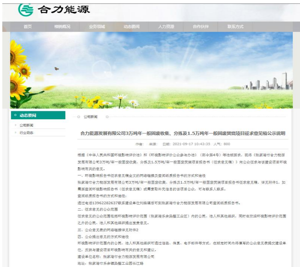
图 3-1 项目环评期间征求意见稿公示网站页面