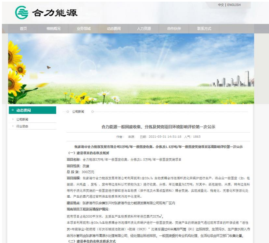
图 2-1 项目环评期间第一次公众参与公示网站页面