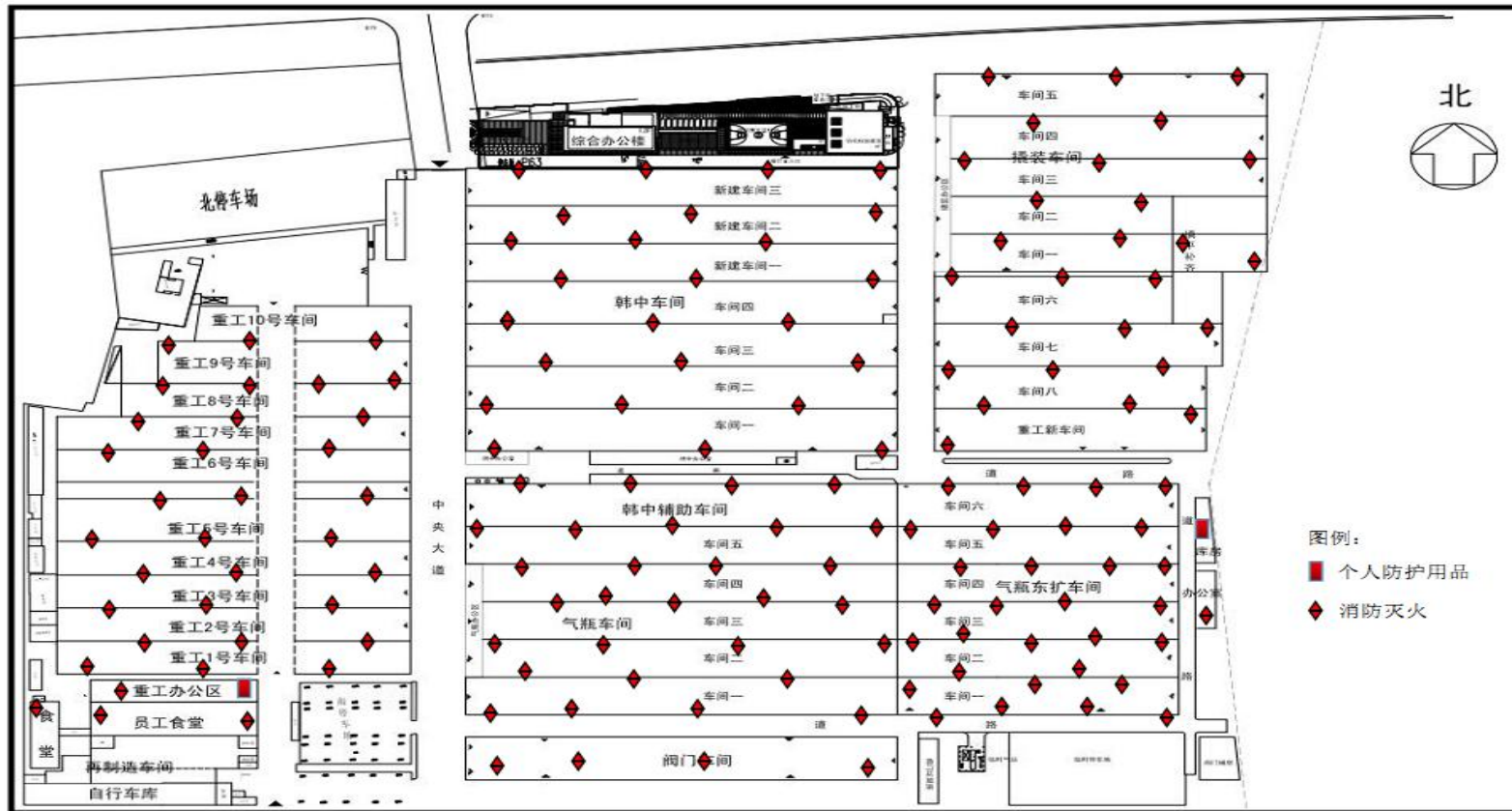
附图 6 应急物资分布图